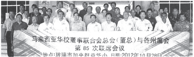
全国董联会代表在开会前合影。