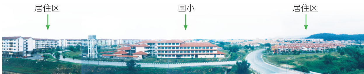
八打灵再也的哥打白沙罗第6区国小 ( SK Seksyen 6, Kota Damansara, Petaling Jaya ) 国小学生到住家附近的国小上学。2004年该国有1012名学生，符合社区学校原理。