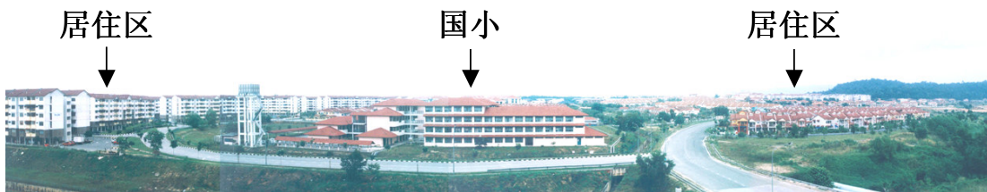
八打灵再也的哥打白沙罗第 6 区国小（SK Seksyen 6, Kota Damansara, Petaling Jaya）国小学生到住家附近的国小上学。2004 年该国有 1012 名学生，符合社区学校原理。

根据社区学校原理，能分配学校保留地以兴建各源流学校，例如可建国小、华小和淡小各 1 所，而实际的分配就根据社区人口结构和居民对各源流学校的需求而定。