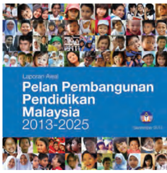
教育部《2013—2025年教育大蓝图》初步报告。