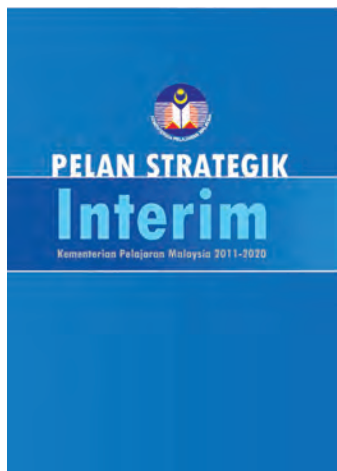
教育部《2011—2020年中期策略蓝图》。