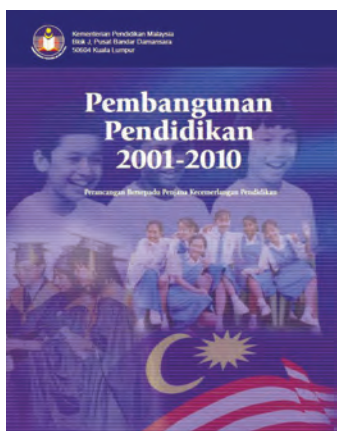
教育部《2001—2010年教育大蓝图》。

2012年和2013年，教育部先后公布了《2013-2025年教育大蓝图》的初步报告和定稿，提出在2021年至2025年实现国小和国中成为所有家长的首选学校，检讨“多种源流学校的选择”和“国家教育体系结构”，并重提宏愿学校计划。