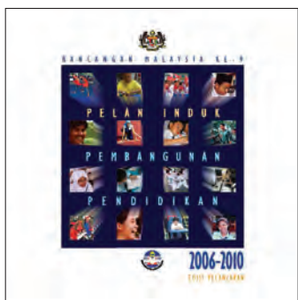
教育部《2006—2010年首要教育大蓝图》。