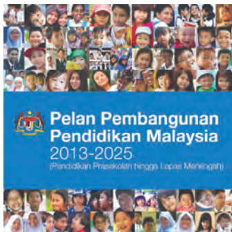
教育部《2013—2025年教育大蓝图》定稿。