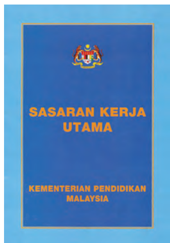
教育部《1994—2000年教育部首要工作目标》。

施》第4.2条文阐明：“在达致国家团结的目标方面，教育扮演着非常重要的角色。以《1956年拉萨报告书》为核心的国家教育政策，明确地强调教育政策的目标，是作为团结国民的工具，特别是在学童方面。因此，国语（即马来语）作为所有种类学校（即各源流学校）的统一教学媒介，是一个最重要的特征，而且必须逐步全面实行。”