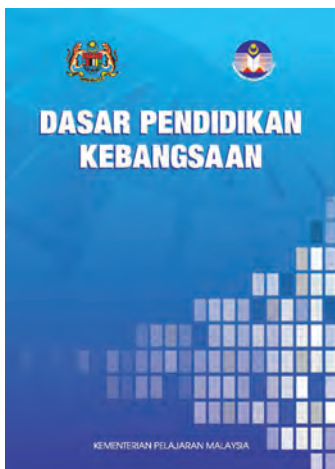
教育部2012年《国家教育政策》。

教育部曾于1985年提出“综合学校计划”，把国小、华小和淡小建在同一个校园，续而于1994年在《1994-2000年教育部首要工作目标》提出同样概念的计划，并于1995年和2010年又提出其翻版“宏愿学校计划”。当局在《2001-2010年教育大蓝图》、《2006-2010年首要教育大蓝图》和《2013-2025年教育大蓝图》，继续推行宏愿学校计划。